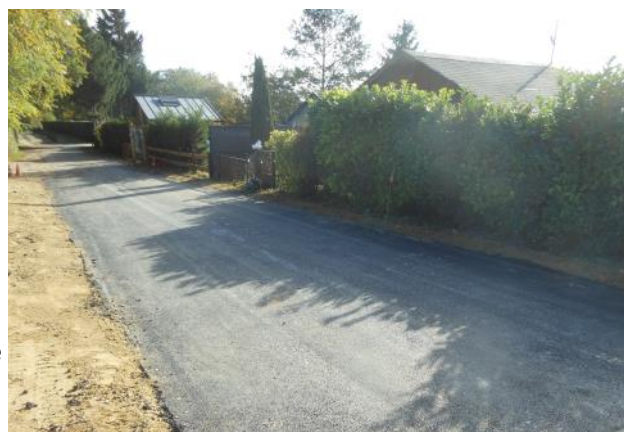
Réfection d'une partie du chemin rural 51