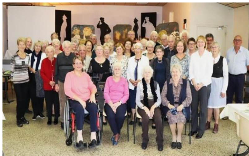
La troupe théâtrale des Amis du Vieux Prouilly et des Anciens du village