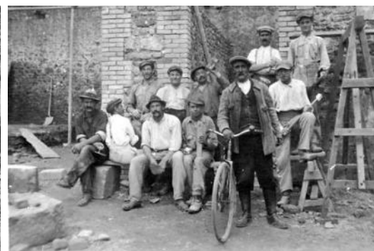
Les maçons de Prouilly (vers 1920 – 1921)

Les baraques militaires étaient en cours de démolition. Le bois récupéré allait servir à la construction de baraquements destinés au logement provisoire des familles, en bordure des villages détruits. Chacun préparait ses dossiers de dommages de guerre, ses demandes d'indemnisation. C'était parfois une tâche complexe.