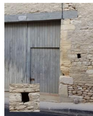
Un trou à clé