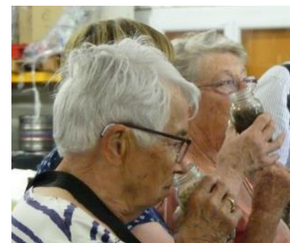
Les parfums du malt