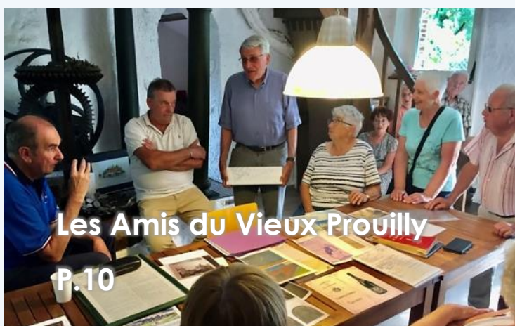
Les Amis du Vieux Prouilly