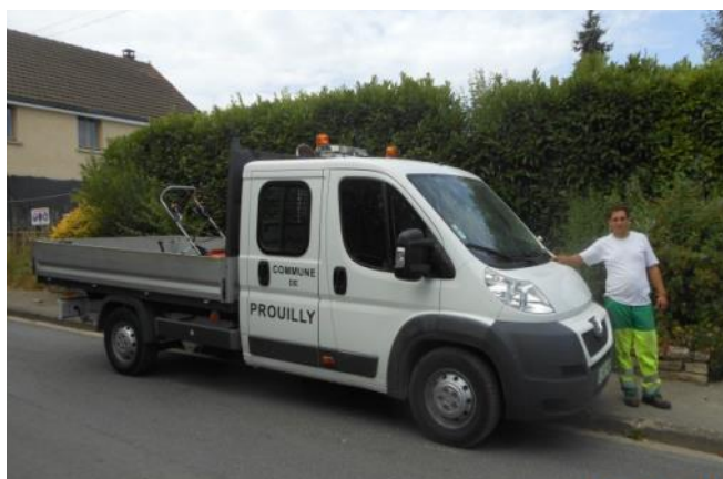
Le nouveau camion communal