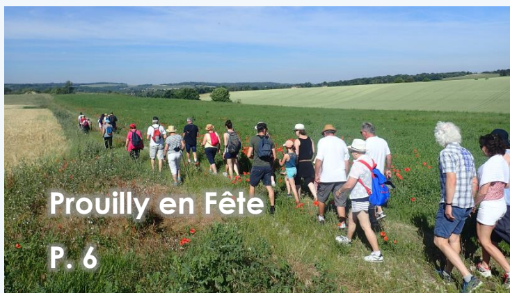
Prouilly en Fête