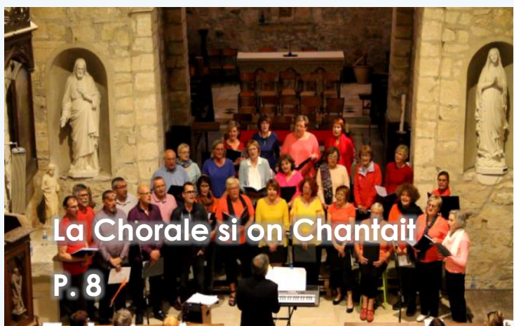
La Chorale si on Chantait