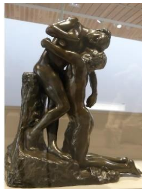
« L'abandon » (vers 1886 – bronze)

L'année 2020 va être consacrée à la recherche et à l'écriture de nouveaux textes traitant de notre patrimoine, des personnalités qui ont marqué l'histoire du village, de la vie communale et des événements marquants ou dramatiques qui s'y sont déroulés.