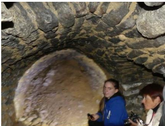
Visite des anciennes caves de Prouilly