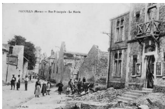
Prouilly en ruines (1919)