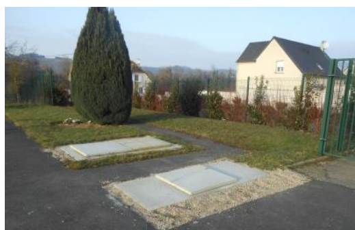
Caveau d'attente et ossuaire