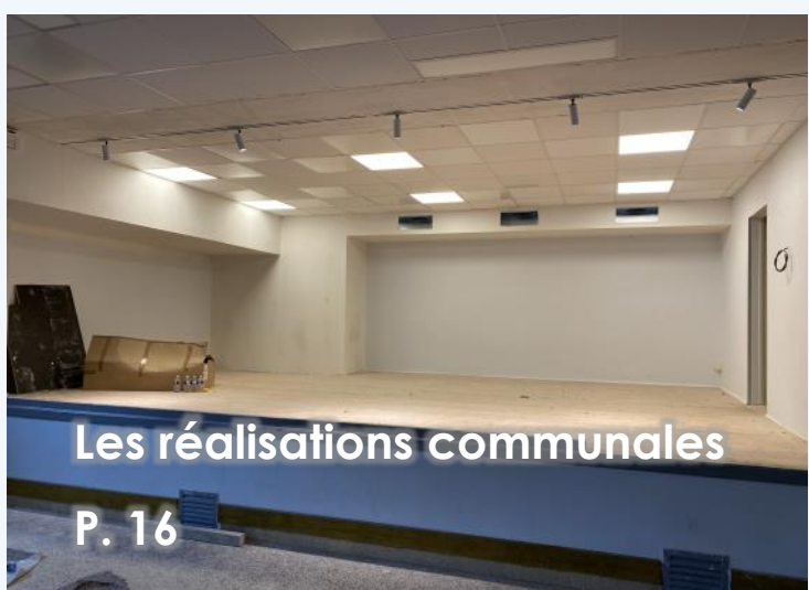
Les réalisations communales