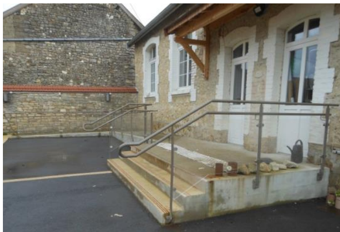
La rampe d'accès à la micro-crèche