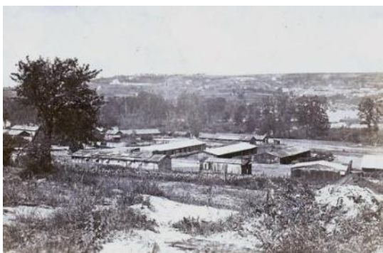
Les baraquements de la Saudan (hiver 1918-19)