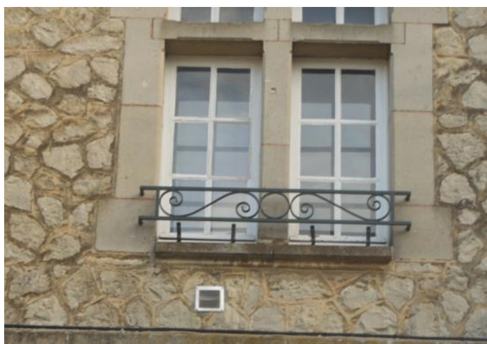
Les garde-corps à la mairie