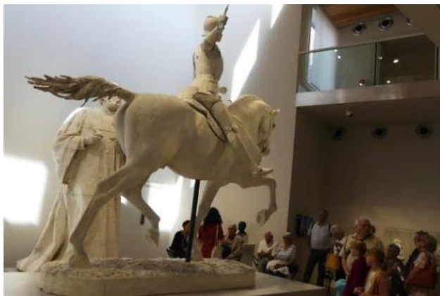
Paul Dubois, Statue équestre de Jeanne d'Arc. Cette statue a été érigée en bronze, à Reims, en 1896.

A Nogent-sur-Seine, avant le repas, le groupe suivit avec intérêt une visite guidée fort intéressante du Musée Camille Claudel . Quatre sculpteurs, renommés de leur vivant, qui ont habité un temps à Nogent-sur-Seine sont mis à l'honneur : Marius Ramus (1805-1888), Paul Dubois (1829-1905), Alfred Boucher (1850-1934), Camille Claudel (1864-1943).