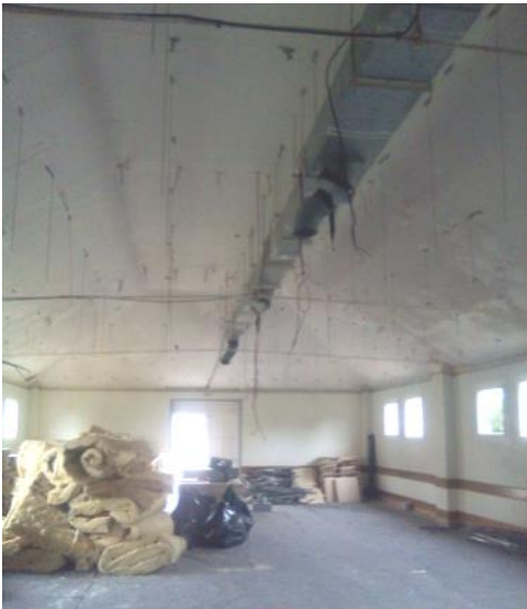
Salle polyvalente après démontage du plafond