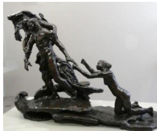
Camille Claudel : « L'âge mur » (vers 1890 – bronze).