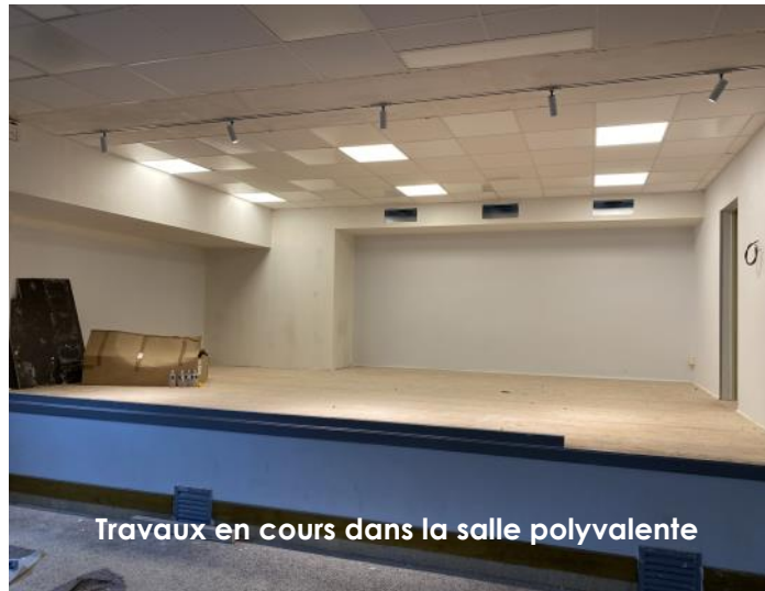
Travaux en cours dans la salle polyvalente