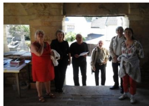
Visites commentées de l'église ; extérieur et intérieur