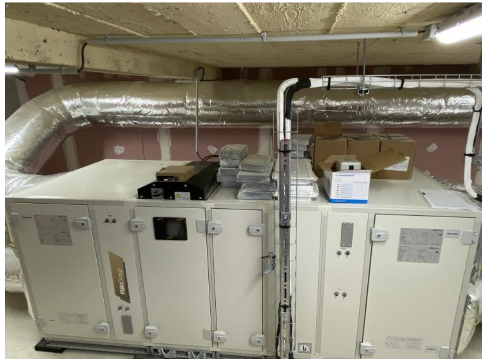
Le sous sol avec la nouvelle chaufferie